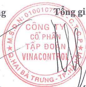
Mai Tiến Dũng